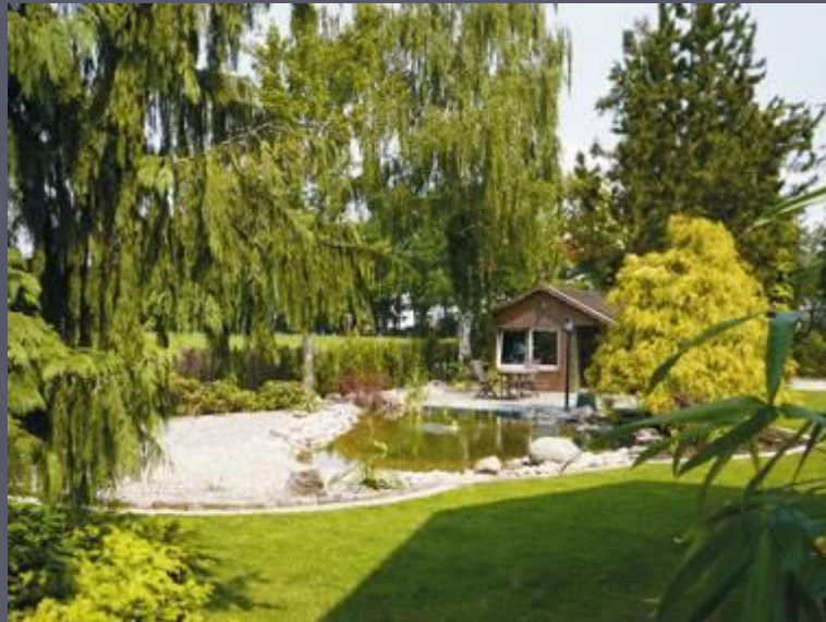
Gartenteich mit Laube