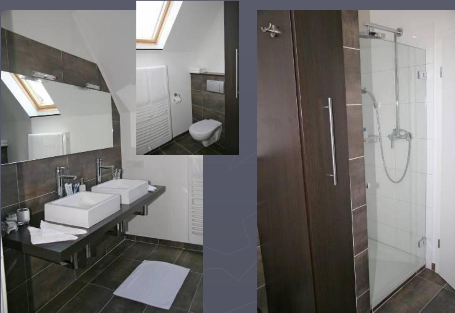
luxuriöses Duschbad mit Toilette und Dusche