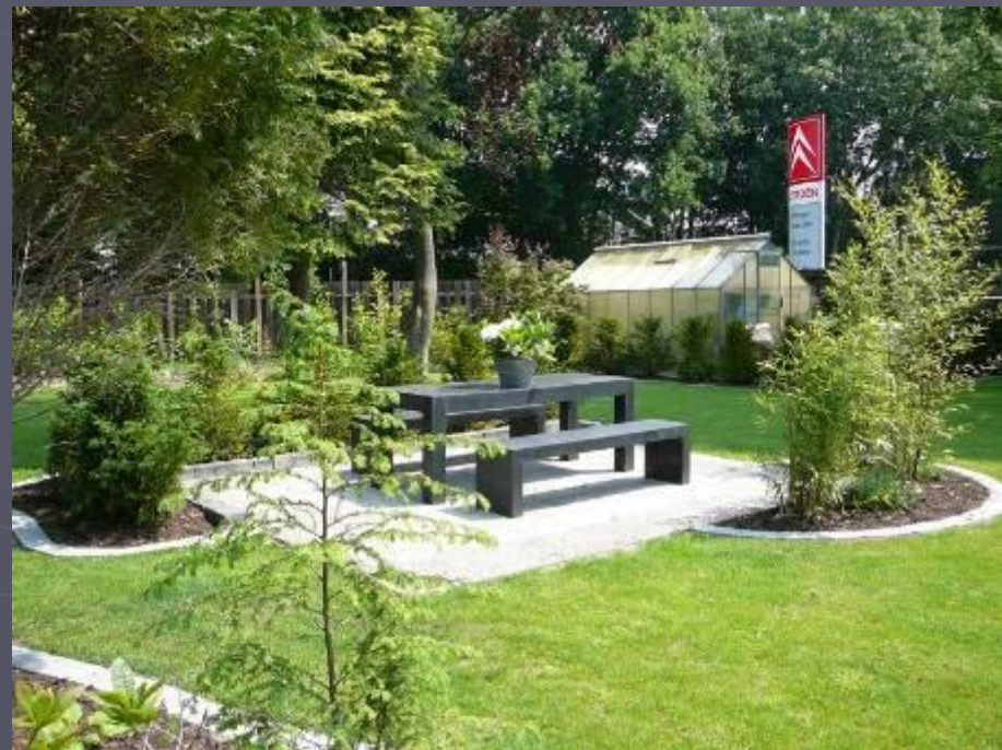
Sitzgruppe auf dem Grillplatz